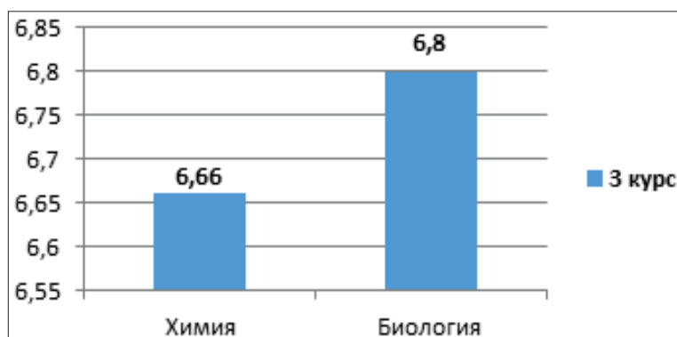
Рисунок 3. Показатели (баллы) объема исследовательских работ в учебном процессе специальностей химии и биологии по определению уровня экологической компетентности студентов 3 курса.

Студенты биологических специальностей 1 курса набрали 6,8 \pm 0,48 балла -определение уровня экологической компетентности соответствует низкому показателю по сравнению с химическими специальностями. Низкий балл получили 6,6% обучающихся, объем составил 4 балла, уровень экологической компетентности средний, 40% набрали 6-7 баллов, а 53,3%-8 баллов (Рис. 3).