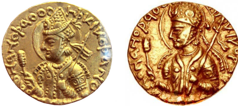
Золотые монеты Хувишки