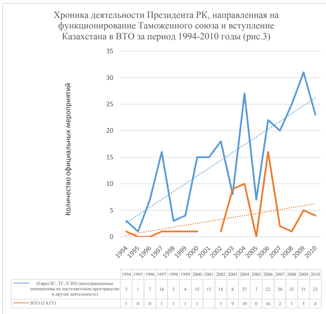
Хроника деятельности Президента РК, направленная на функционирование Таможенного союза и вступление Казахстана в ВТО за период 1994-2010 годы (рис.3)

Кривые графика иллюстрируют устойчивое намерение Казахстана сначала «укреплять Таможенный союз и Единое экономическое пространство» [17], посредством которых республика стремится «к скорейшему присоединению на скоординированных условиях к Всемирной торговой организации» [18, 19].