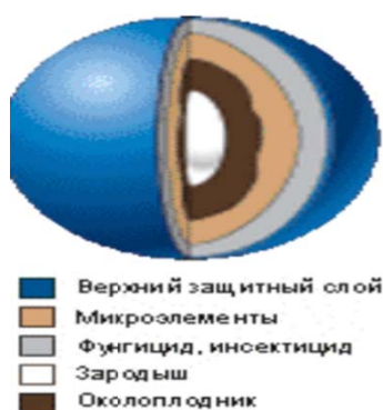
Рисунок 1 – Состав и строение дражжированного семени

Дражжирование семян – это обволакивание семян оболочкой с целью увеличения размеров и образования равномерно шарообразной формы у каждого семени. Размеры дражжированных семян: для мелких семян 3-4 мм, для средних 5-6 мм, для крупных 10 мм и более. На рисунке 1 представлено строение дражжированного семени [5,6].