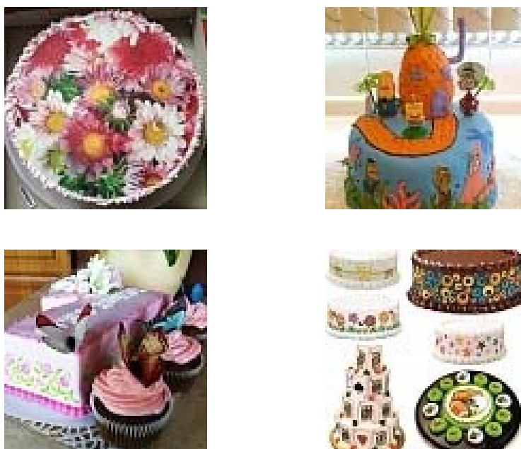
Рисунок 3 – Цветовые изображения, нанесенные на торты, шоколад

3D-принтер ChefJet, печатает не только сахаром, но и шоколадом или любой крошкой, которая слипается при обработке водой. Принцип работы Foodini также достаточно простой. Устройство использует ручную заряжаемые картриджи наподобие шприцов. В качестве расходных материалов используется любая еда в пастообразном состоянии. Например, для печати пиццы в один шприц закладывается тесто, в другой – расплавленный сыр, в третий – томатный соус [5].