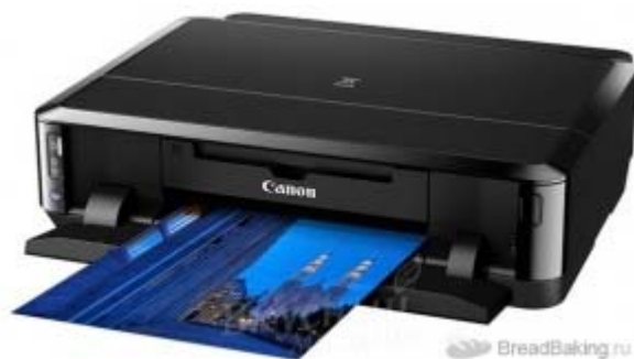
Рисунок 2 – Пищевой 3D-принтер canon