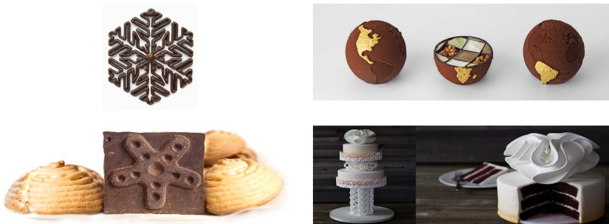
Рисунок 4 – Примеры блюд сложных форм шоколада, в том числе многокомпонентных, изготовленных на 3D-принтере

Широко известен фруктовый принтер, разработанный компанией Dovetailed. В нем используется способ наполнять натриевый гель вкусовыми добавками, имитирующими, ягоды, например, клубнику, фрукты [2]. Заслуживает внимания принтер 3D-Everything от TNO (Nederlandse Organisatie voor Toegepast Natuurwetenschappelijk Onderzoek). Судя по всему, эта голландская исследовательская группа, рассматривая вопрос 3D-печати пищи с 2012 года, относится к нему, как к важному технологическому прорыву, а не кухонной фантазии. Одна из задумок TNO, это печать бисквитов из сухих фруктов, овощей, орехов, наполненных дрожжами, бактериями и пророщенными семенами [6]. Появились сообщения, в котором делаются попытки научиться печатать 3D-мясо. Как известно, технологии, позволяющие создавать органические ткани, уже существуют. Пищевые 3D-принтеры уже позволяют печатать одноцветные конфеты и глазурь со вкусом шоколада, ванили, мяты, яблока или вишни. Профессиональные кондитеры вскоре получат в свое распоряжение новые устройства, предлагаемые компанией 3D Systems – принтеры ChefJet и ChefJet Pro [2, 6]. Процесс изготовления в них основан на технологии трехмерной струйной печати: гранулированная сладкая смесь наносится тонким слоем, а затем выборочно «склеивается» водой, подаваемой через сопло рабочей головки. Пищевые добавки и красители позволяют добиваться различных вкусовых оттенков и цветов, сложной формы (рисунок 4) [1, 2, 6].