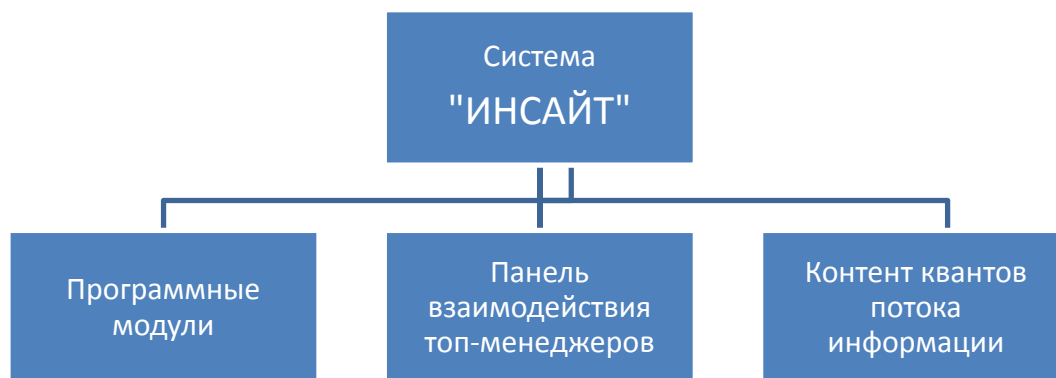
Рисунок 1 – Компоненты системы «ИНСАЙТ»

Каждый модуль представляет собой модель базы непрерывно пополняющихся знаний через интернет или облачный сервис субъектов–членов команды управления, разработанной с использованием элементов латерального мышления. По теме запроса через панель взаимодействия выдаются порядковые номера всех записей данной темы.