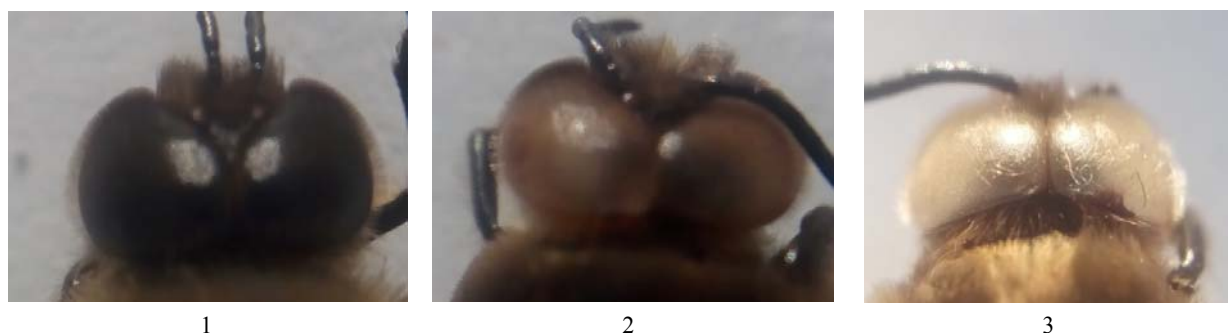
Figure 2 – Morphological anomalies of the eyes of drones: 1 - normal eyes; 2 - brown or pomegranate eyes; 3 - white eyes

In numerical ratio, the maximum number (33.0%) of drones with brown or pomegranate eyes was registered in the forest-steppe area (Table 2). Also, one drone with white eyes (0.3%) was recorded in the apiary of this territory. In the steppe and forest honey flow areas, drones with only brown or pomegranate eyes were observed - 12.8% (steppe zone) and 26.3% (forest zone).